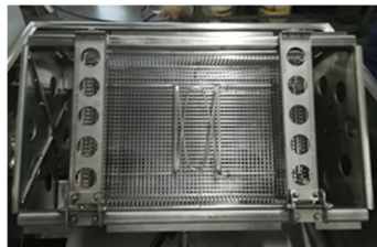
Korg med lock i maskinen