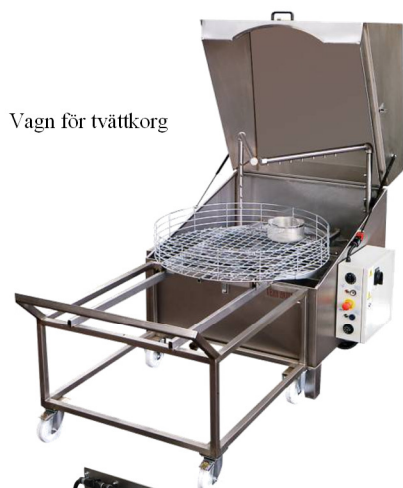
Vagn för tvättkorg

Ventilationsfläkt. Utdragbart korg på vagn. Motoriserad rotation av korg. Oljeskivskimmer. Tömningspump. Spolrör samt korg i rostfritt stål. Nivåkontroll samt automatisk vattenpåfyllning. Isolerad maskin. Högtrycksspoling med manuell spoling.