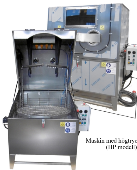
Maskin med högtryckspump (HP modell)