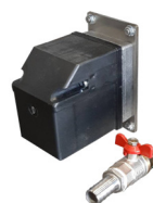
Skivskimmer för oljeavlägsning