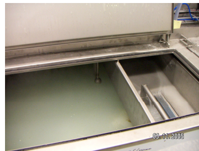
Åtkomlighet i tank

CE märkt maskin enligt gällande maskindirektiv.