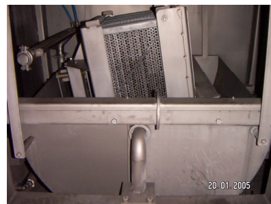
Rotation av korg. Vinkel och hastighet är steglöst justerbart.